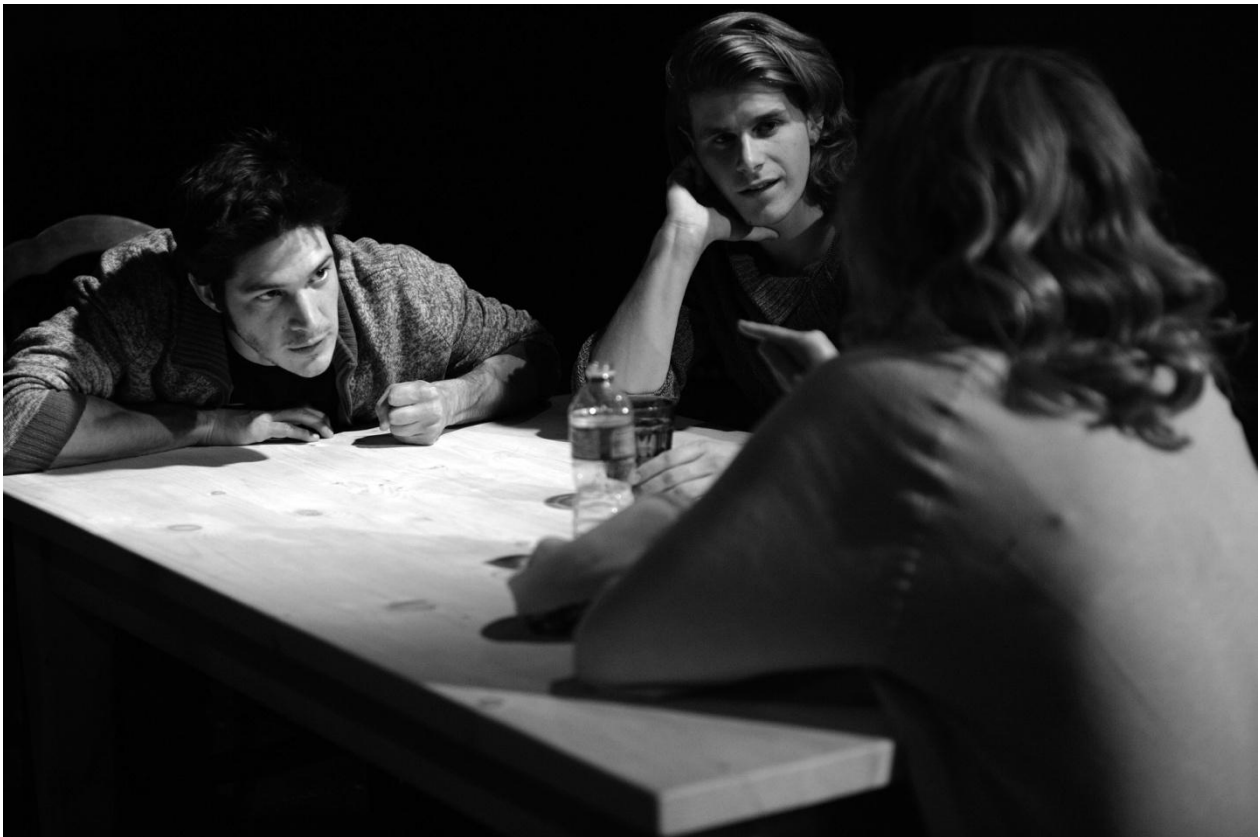
En répétition

Tom, un jeune publicitaire, moderne et urbain, se rend en province aux funérailles de son amant décédé dans un accident de la route. C'est sur une ferme laitière et isolée qu'il rencontre pour la première fois la mère du défunt. Elle n'a aucune idée de qui il est ni de ce qu'il a vécu avec son fils. Tom découvre alors l'autre réalité fabriquée par celui qui n'est plus là : celle d'un homme amoureux d'une femme nommée Ellen. Pour ne pas décevoir sa mère, le frère du défunt contraint Tom, par la menace et les coups, à participer à la supercherie. Tom en quête d'exorcisme de son deuil devient étrangement fasciné par ce que lui fait subir Francis.