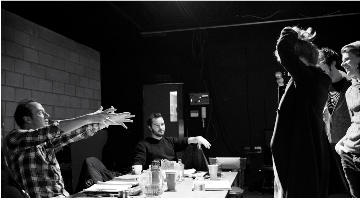
En répétition