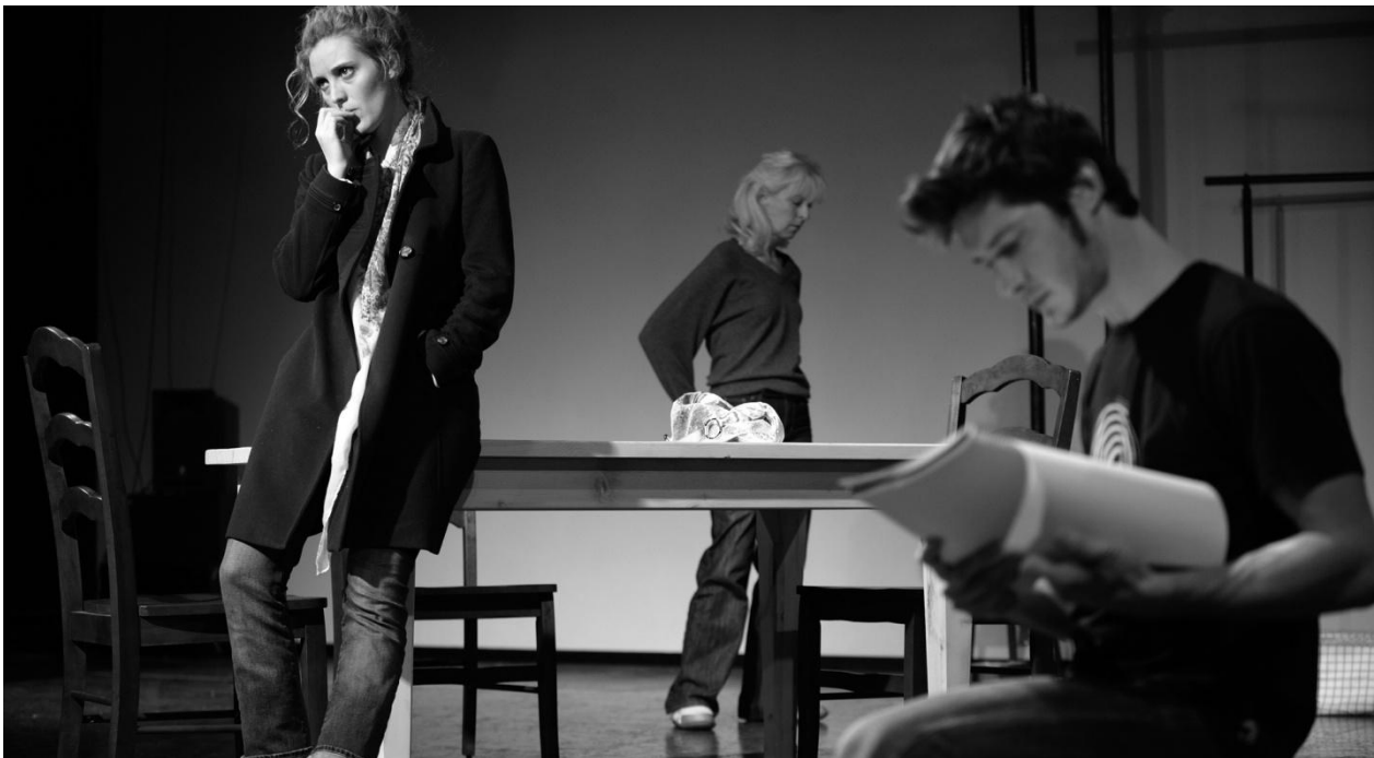
En répétition // photo Valérie Remise