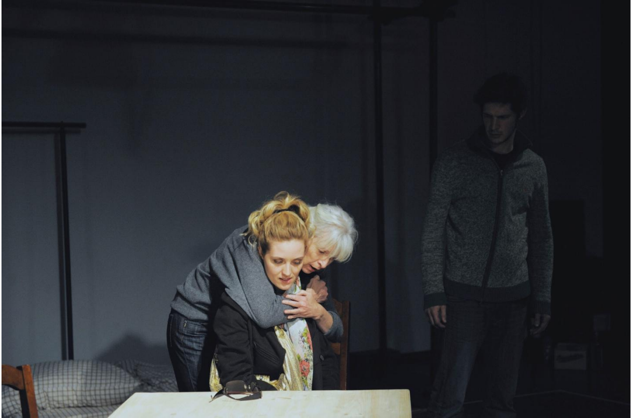
En répétition